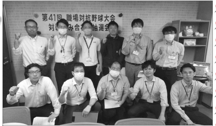
意気込む各チーム！

5月8日(水) 職場対抗野球大会代表者会議が組合事務室でおこなわれ、大会運営の確認と組み合わせ抽選会をおこないました。