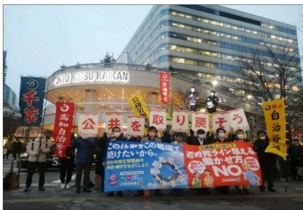
有楽町イトシア前で宣伝行動

(続き) 中央行動を終え、「公共を取りもどす」トワイライト宣伝行動を行いました。自治労連の仲間が「誰もが安心して暮らしつつつけられる地域を」と呼びかけました。