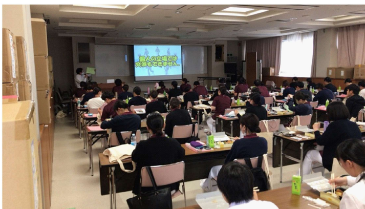
新入職員説明会の様子 (D3会議室)

用意した弁当を新入職員に配りムービーで労働組合の存在意義や取り組んでいること、また組合が提供する様々な福利厚生などを紹介しました。その後自治労連共済の説明などをしました。新入職員の皆さん貴重な時間をありがとうございました。