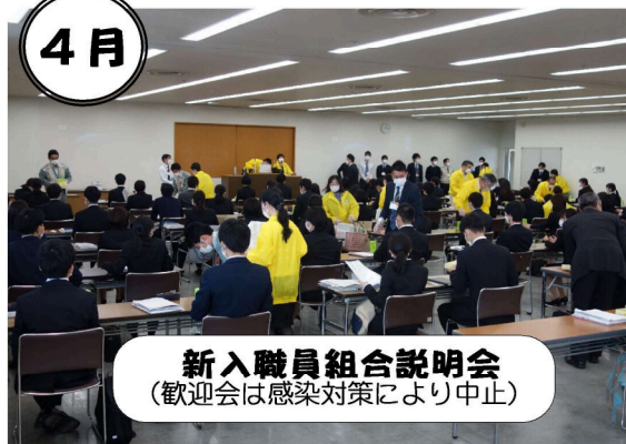
新入職員組合説明会 (歓迎会は感染対策により中止)