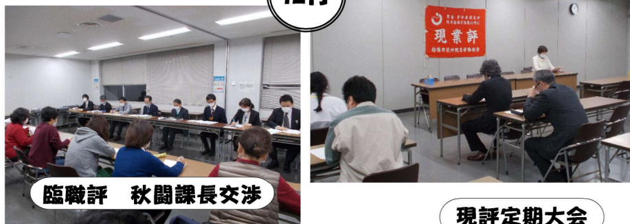
臨職評 秋副課長交渉