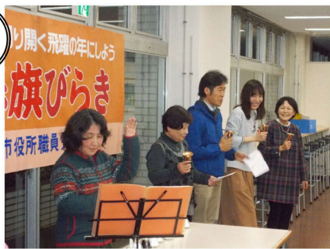
執行役員によるハンドベル演奏