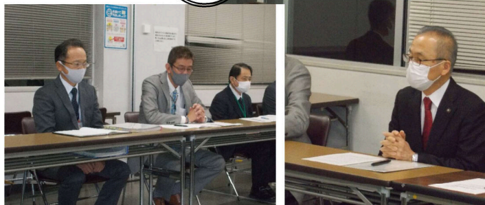
一時金 課長・部長交渉

2020年の「ふなみち」は今号が最終号です。 来年も引き続きよろしくお願いたします。