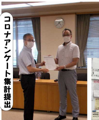
コロナアンケート集計提出