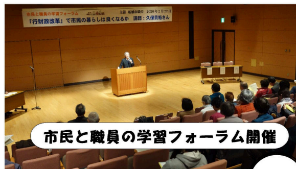
市民と職員の学習フォーラム開催