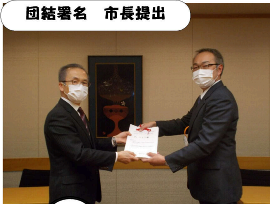
団結署名 市長提出